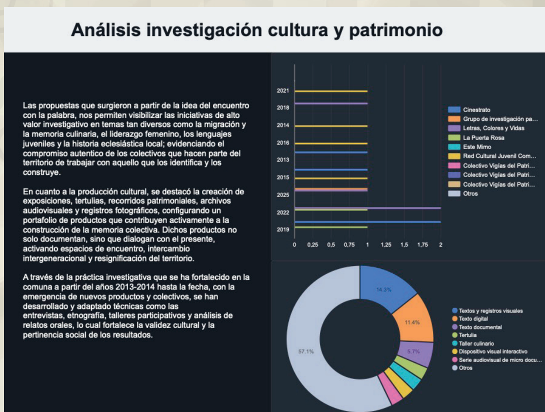
Imagen 1. Análisis sobre investigación en memoria y patrimonio

Las propuestas recibidas y analizadas evidencian el compromiso de la comunidad cultural de la comuna 4 con la investigación patrimonial sistemática, desde el territorio, con apuestas creativas que interrogan los discursos hegemónicos y amplifican la voz de los actores sociales. Es posible